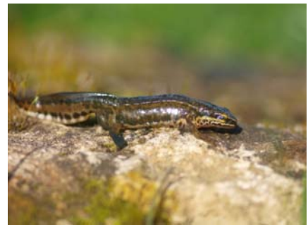
Triton ponctué triturus vulgaris

Nous avons aussi observé, mais plus rarement, le triton ponctué. Comme le triton palmé, sa taille peut atteindre 9 cm. En période nuptiale le mâle a une crête dorsale et des points noirs sur le corps. Le dessous du ventre est orangé.