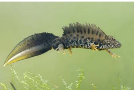
Triton crêté triturus cristatus mâle adulte

De la famille des urodèles, les tritons (étymologiquement ceux qui règnent sur les eaux) se caractérisent comme la salamandre par un corps cylindrique, une tête courte et une queue allongée. Ils sont carnivores et possèdent des dents sur la mâchoire supérieure et inférieure. Leur respiration est pulmonaire. Ils sont capables de régénérer un membre sectionné telles que la queue ou les pattes. Tout comme les grenouilles et les crapauds, ils mènent une double vie terrestre et aquatique : ce sont des amphibiens.